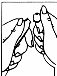
Abb. 2 Ampullenhals vom Punkt wegbrechen.